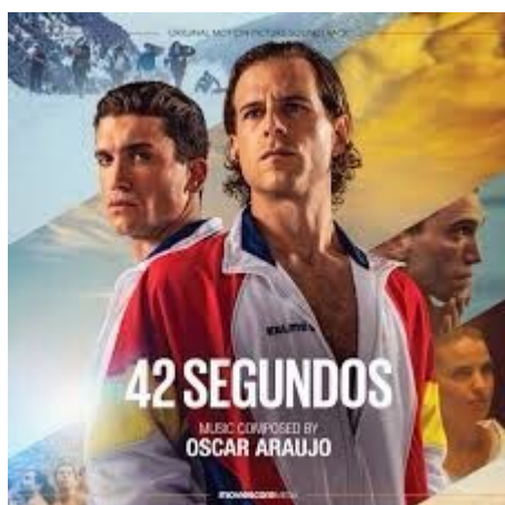
fig.4, locandina del film

42 segundos (2022) di Alex Murrull e Dani de la Orden (fig.4).