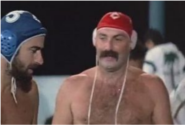
(fig.1) una scena di Palombella Rossa