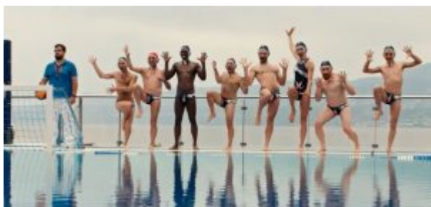
fig.3, una scena del film.

Gamberetti per tutti (Les crevettes pailletées 2019) di Cédric Le Gallo e Maxime Govare (fig.3) .