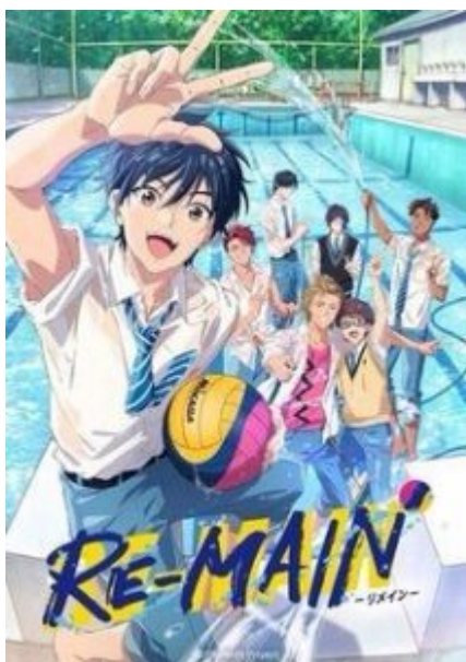
fig.6, un'immagine della serie.[5]

Re-Main ㊦㊦, (fig.6), una serie televisiva anime di genere spokon prodotta dallo studio MAPPA e trasmessa su TV Asahi nel 2021. La serie è stata inoltre pubblicata in simulcast con sottotitoli in italiano da Yamato Video sul canale YouTube Yamato Animation e su Prime Video con una settimana di differita[4]. Minato Kiyomizu campioncino u14 di pallanuoto subisce un incidente e per sei mesi resta in coma perdendo la memoria. La nemesi avviene attraverso la ripresa degli allenamenti di pallanuoto con il riaffiorire dei ricordi e dei fondamentali del gioco.