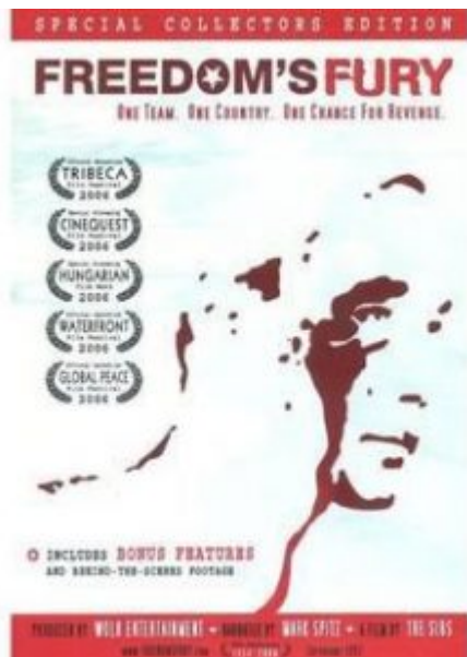
fig.2, locandina del film

La curiosità per questo film nasce proprio in relazione ad un primo storico “strappo” tra la sinistra storica ed un gruppo di intellettuali [2]. Nel 1956 l’Ungheria nazione del blocco orientale, passò sotto il controllo politico dell’Unione Sovietica. I magiari insorsero contro l’URSS in un tentativo di indipendenza che fu interrotto in poche settimane quando le truppe sovietiche occuparono con i carri armati il paese per sedare la rivolta democratica. Quello stesso anno, con il ricordo ancora vivido delle violente rappresaglie dell’invasione dell’URSS, sovietici e ungheresi si incontrarono su un altro campo di battaglia: l’ultima partita del girone finale valido per l’oro olimpico di pallanuoto ai Giochi Olimpici di Melbourne del 1956. Determinata a non cedere ai sovietici, la squadra ungherese giocò una partita aggressiva che fu descritta da molti come la gara di pallanuoto più violenta della storia delle Olimpiadi[3]. Il regista Colin Keith Gray ripercorre questi eventi topici della storia ungherese con il documentario Freedom’s Fury, che racconta le storie sia della rivoluzione ungherese che della squadra nazionale di pallanuoto contro l’Unione Sovietica, anche se solo nella competizione olimpica. La leggenda del nuoto olimpico Mark Spitz è voce narrante del film in lingua originale.