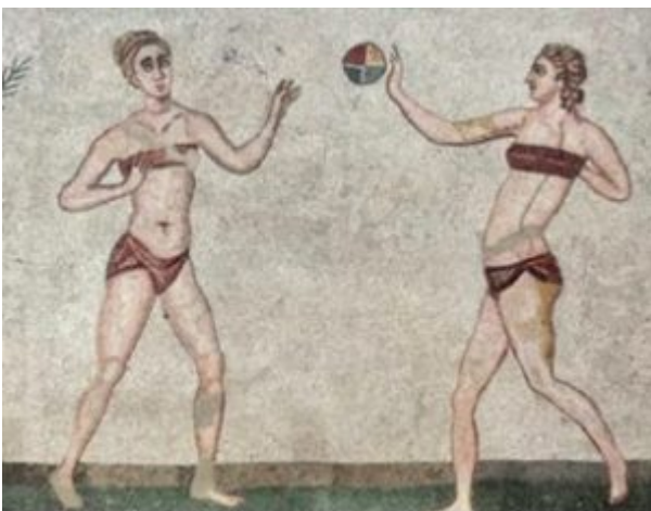
fig. 3 – Particolare del Mosaico di Piazza Armerina.

Un ulteriore indizio, ci perviene dal mondo romano, con un mosaico della bellissima Villa del Casale di Piazza Armerina (EN), patrimonio dell'Umanità protetto dall'UNESCO [6] .