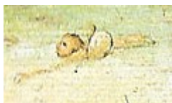
fig. 6 – particolare da Giochi di Bambini, bambino che nuota con una sfera, una vescica di maiale gonfia d'aria, in un rigagnolo.

Il dipinto è un interessante documentario sui giochi per l'infanzia del passato: vi sono infatti rappresentati circa 80 giochi che si svolgevano nel Cinquecento. La scena è una fantasmagoria di bambini, sono circa 250, che svolgono diverse attività ludiche, tra cui, per quel che qui interessa, un gioco che si svolge nella parte alta a sinistra del quadro: