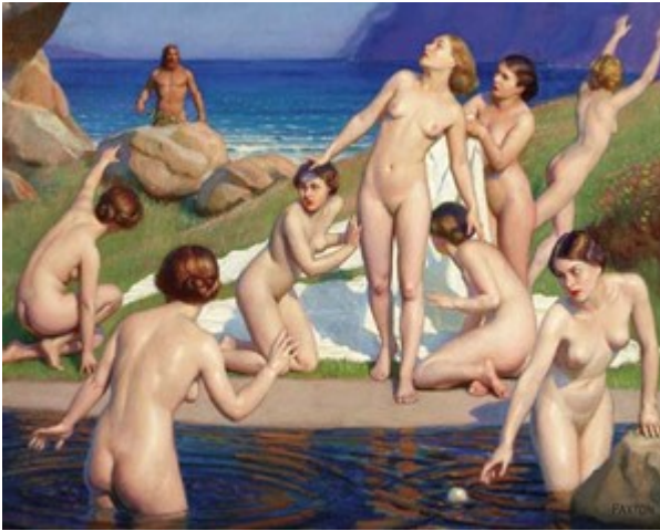
fig. 2 – Ulysses e Nausicaa, William McGregor Paxton.

Dunque, un indizio sul gioco di una palla in un non meglio precisato specchio d'acqua, fiume o mare, offre un primo elemento di associazione di palla e acqua non trovando ancora la simbiosi con il nuoto.