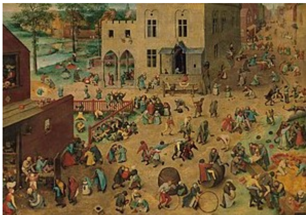
fig. 5 – Pieter Bruegel il Vecchio, Giochi di bambini.

Il dipinto è un interessante documentario sui giochi per l'infanzia del passato: vi sono infatti rappresentati circa 80 giochi che si svolgevano nel Cinquecento. La scena è una fantasmagoria di bambini, sono circa 250, che svolgono diverse attività ludiche, tra cui, per quel che qui interessa, un gioco che si svolge nella parte alta a sinistra del quadro: