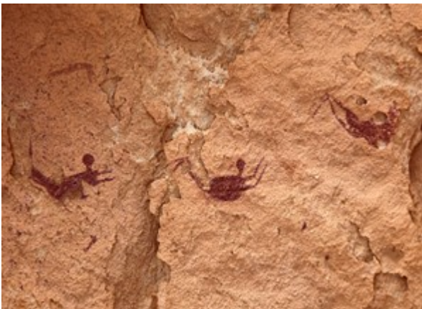
fig. 1 – Grotta dei nuotatori. [1]

La grotta (fig. 1) e le incisioni rupestri della Grotta dei nuotatori furono scoperte nel 1933 dal conte ungherese László Almásy. Nella grotta sono contenute pittografie neolitiche di persone che nuotano. L'ipotesi di base è che siano state dipinte in un arco temporale che va dai 10.000 ai 5.000 anni fa, al termine dell'era glaciale. Infatti, in quella zona al confine tra il deserto libico e l'Egitto si era formato un enorme lago, oggi completamente coperto dal deserto.